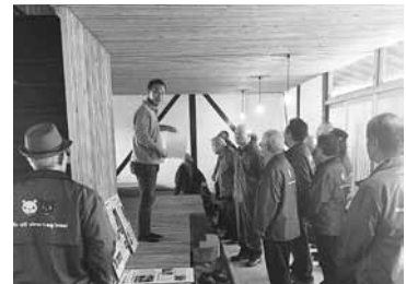
穎娃町別府石垣商店街を視察

交流協定を締結している南九州市を訪問し、地域のまちづくり等について意見交換を行いました。また、同市の穎娃町別府石垣商店街を視察し、まちづくり専門のNPO法人による地域活性化の事例等の説明を受けました。二日目は桜島国際火山砂防センターにて、火山地帯の噴火や風水害等の防災のあり方を視察しました。地域活性化やまちづくり・防災は、行政と地域コミュニティが連携して取り組んでいかなければならないと感じました。